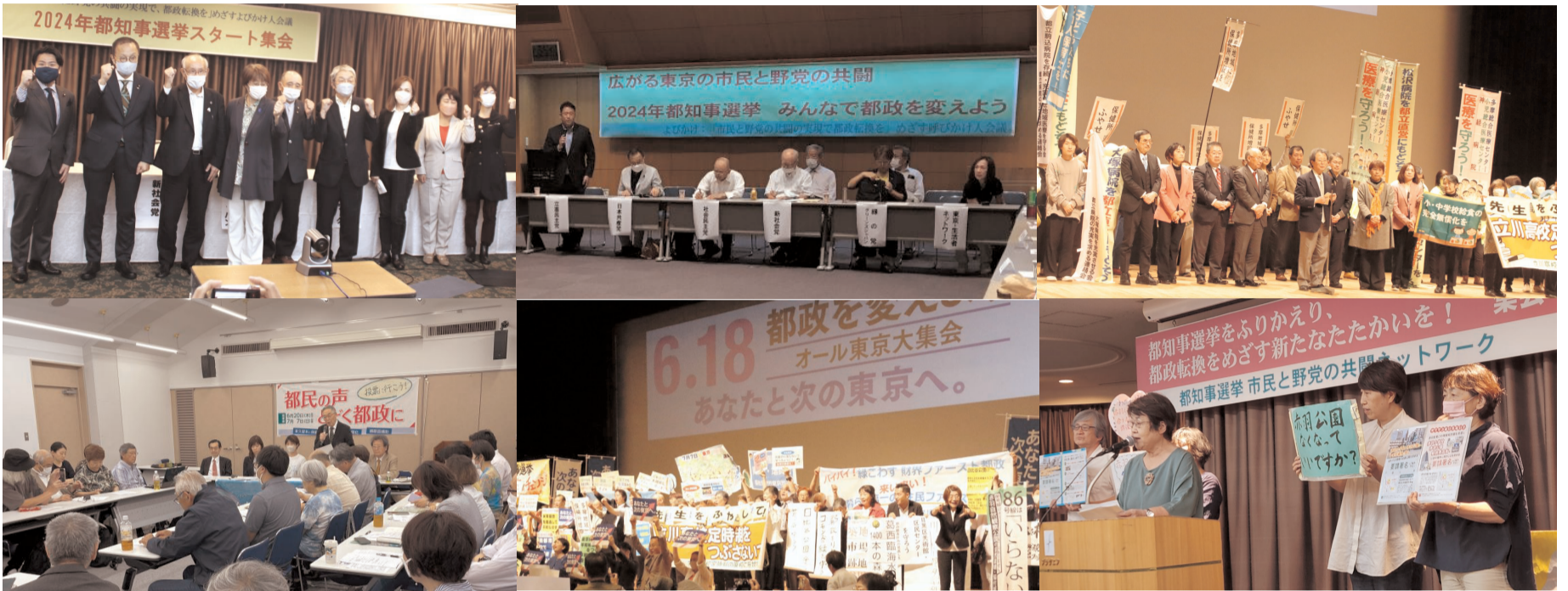
<左上>2024年都知事選挙スタート集会(2022.10.05) <中上>市民と野党の懇談会(2023.09.23) <右上>1・24 キックオフ集会(2024.01.24) <左下>都知事選挙政策を都民目線、みんなで考え、つくっていく会(2024.05.27) <中下>6・18 都政を変えよう！オール東京大集会(2024.06.18) <右下>都知事選挙 市民の野党の共闘ネットワーク集会(2024.09.26)