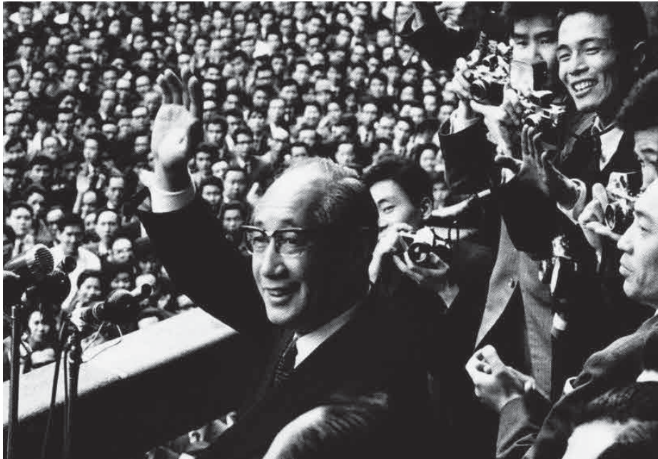
初登壇・都民に心える美濃部亮吉都知事(1967年4月)

いまから50年前の1967年4月、日本の首都に、都民が主人公の革新都政(美濃部亮吉都知事)が誕生しました。革新都政誕生の原動力は、社会党共産党を軸とした統一戦線の結成と切実な都民要求と運動、都議会汚職事件など伏魔殿都政と都民不在の自民党保守都政に