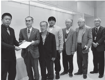
「2018年度都予算編成は都民本位に」と都知事要請を行う革新都政の会=17年11月27日・都庁

主催 革新都政をつくる会 03-5978-4031 (fax) 03-5978-5052 後援: 東京民報社 http://kakushintosei.org/ E-mail: info@kakushintosei.org