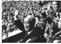
初登壇/都民に応える美濃部亮吉都知事

本年は、憲法を都政に生かし、「都民が主人公」の立場から、くらし、福祉、教育、営業などさまざまな分野で、都民要求にこたえ、全国に先がけた先進的な施策を実施した革新都政の誕生50周年です。この間、革新都政をつくる会は、革新都政実現の母体となった統一戦線組織「明るい革新都政をつくる会」のたたきを引き継ぎ、「都民が主人公の都政」の実現のために全力をつくしてきました。この国と都政のあり方が問われ、切実な都民要求実現を求める運動が高まり、共同が広がる中で、下記のように革新都政50周年記念シンポジウムを開催します。どうぞ、お誘いあわせください。