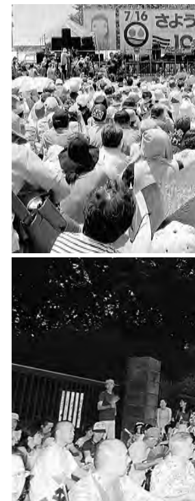
【上】「原発なくせ!」の 「7.16 大行動」 【下】「原発なくせ!」の 「7.29 大行動」

なくせ原発! 国民の願いひとつに 7・16代々木公園 17万人 7・29国会大包囲 人間の鎖の輪 「原発ない!」「原発 なくせ!」という国民の意思が 代々木公園に結集しまし た。7月16日に世界的音楽 家の坂本龍一さん、ノーベ ル賞作家の大江健三郎さん ら著名9氏が呼びかけた 「さよなら原発100万人集 会」。「福島に沈黙す るのは野蠻」(坂本龍一) 「集まり言い続けよう」(瀬 戸内寂聴)と呼びかけ、真 夏の日に差しに照らされた会 場に、幼い子連れられた若 夫婦や、白いタオルを首か