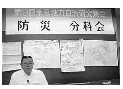
第9回東京地方自治研究会 防災分科会