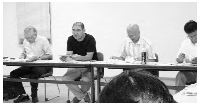
「東京のいのちとくらし、福祉・社会保障問題交流学習会」を開催=12年7月25日・東京労働会館

7月25日(水)、東京労働会館3階会議室において、都政転換「重点政策2012」の貧困・雇用、いのちとくらし、福祉と社会保障の政策づくりにかかわって、関係専門分野の方々に、東京におけるそれぞれの現状と検討課題を報告して頂く、交流と学習会を開催しました。