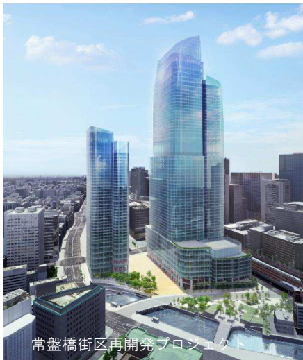
常盤橋街区再開発プロジェクト