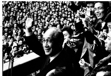
初登庁／都民に応える美濃部亮吉都知事