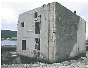
横倒しになったビル