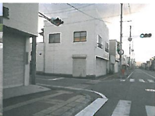
人がなくなった町