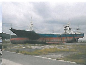
内陸深く打ち上げられた船