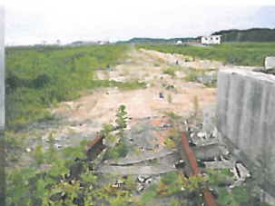
断ち切られた線路